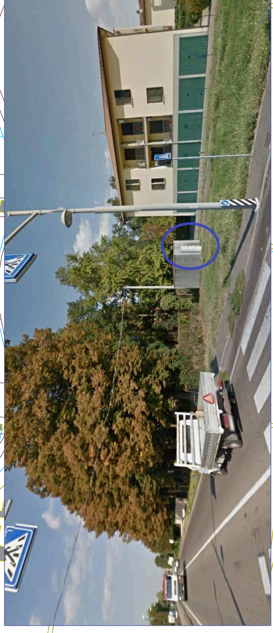
QUADRO ELETTRICO ESISTENTE COMUNE RE