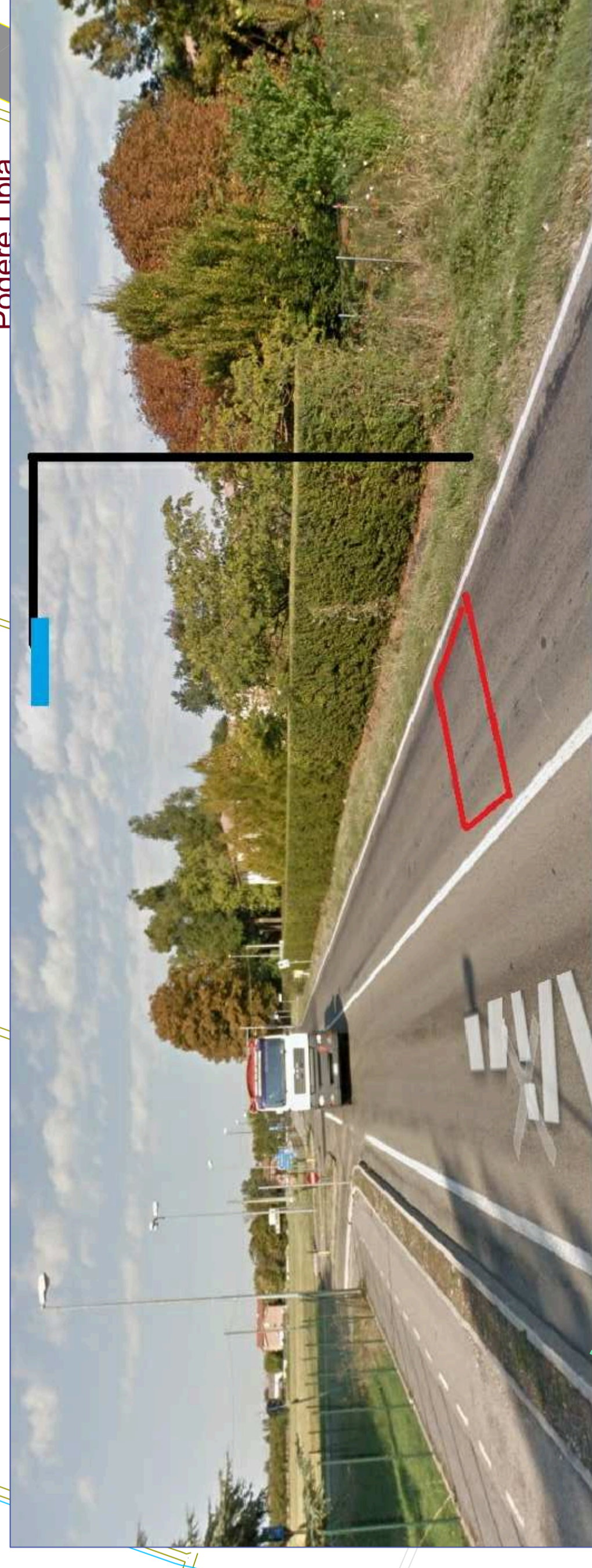
POSTAZIONE VELOX MONODIREZIONALE