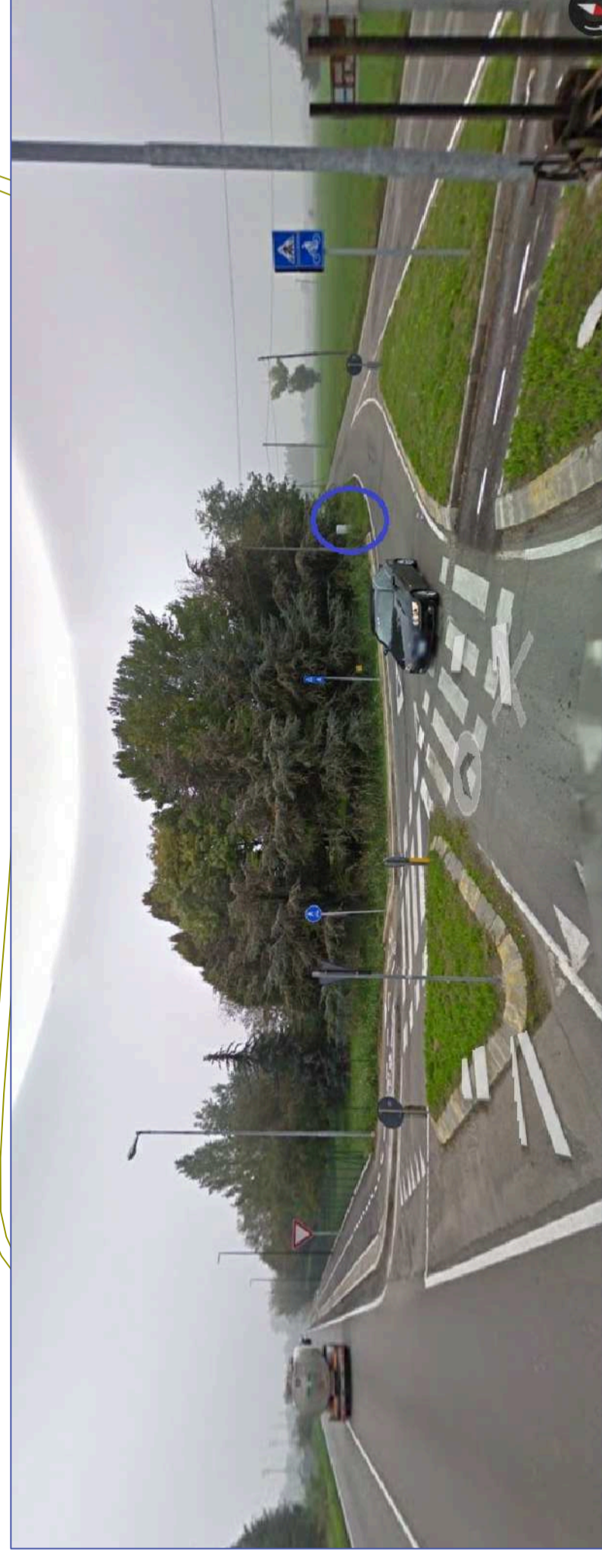
QUADRO ELETTRICO ESISTENTE COMUNE RE