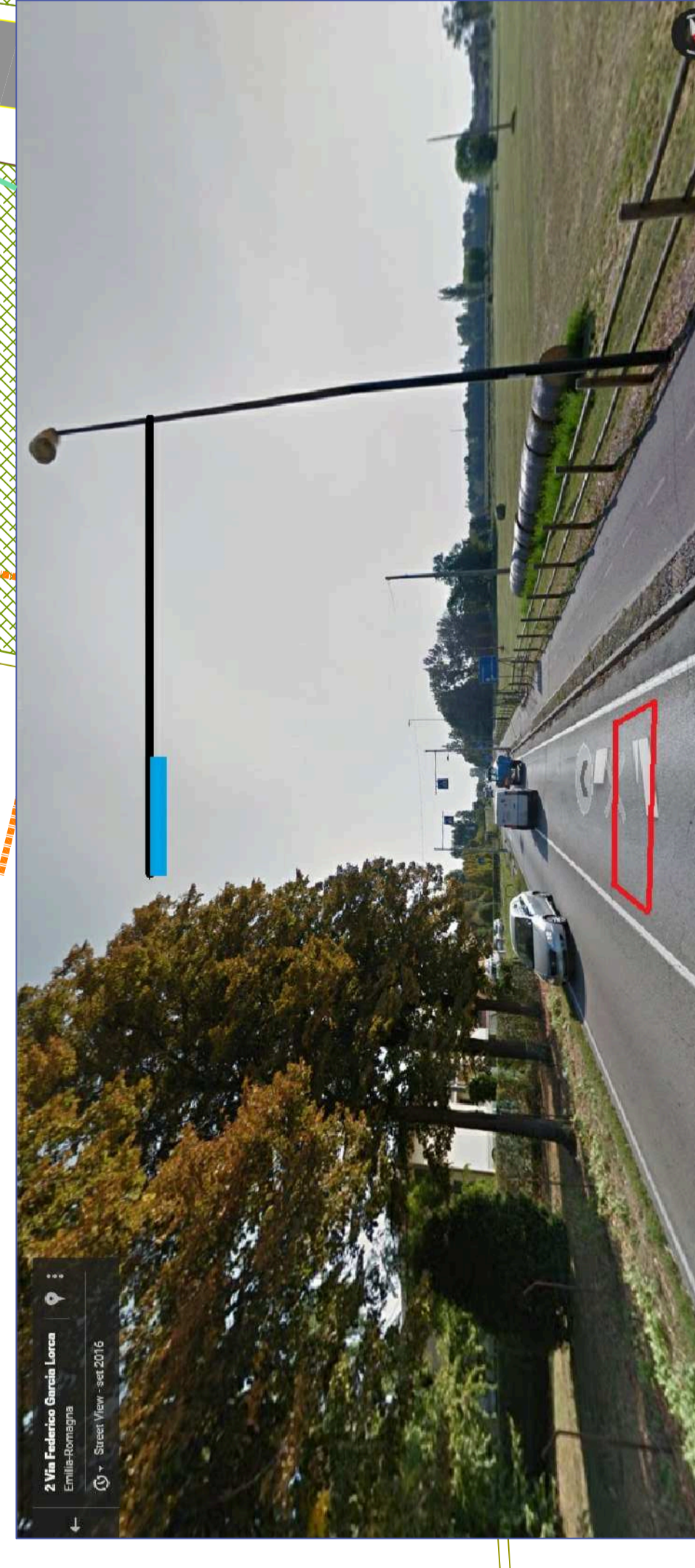
POSTAZIONE VELOX MONODIREZIONALE